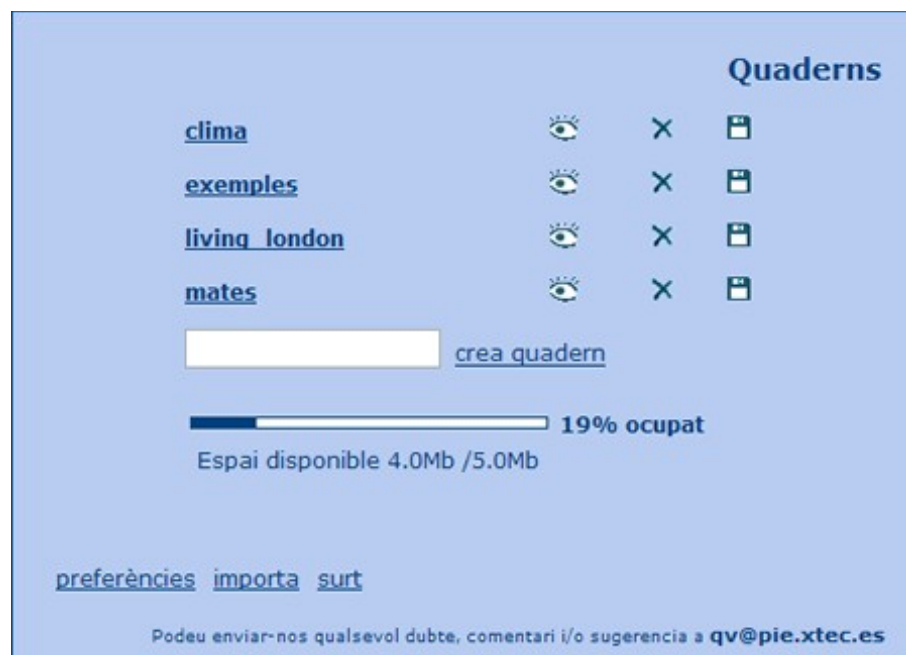
Figura 6. Índex de quaderns de l'editor

L'accés a l'editor es fa mitjançant Internet ( http://clic.xtec.net/qv_editor ) i és necessari autenticar-se com a usuari de l'edu365.com (servei d'Internet que el Departament d'Educació posa a disposició de tota la comunitat educativa catalana). Un cop dins de l'editor, cada professor disposa de 5MB d'espai al servidor, on anirà emmagatzemant els quaderns que vagi creant i els elements de disseny visual i multimèdia que necessiti cada quadern.