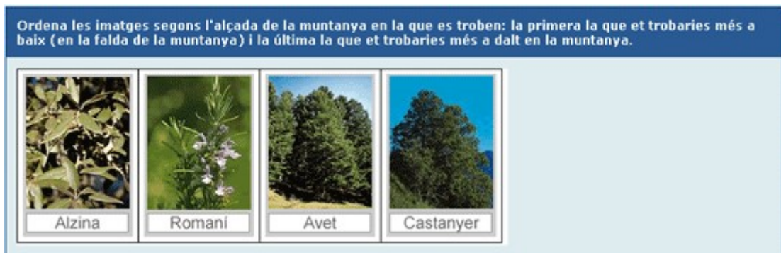
Figura 2. Exemple d'activitat d'ordenació

S'ha d'ordenar un conjunt d'elements que es presenten desordenats. Per establir l'ordre correcte caldrà moure cada objecte a la posició adient. La orientació de les respostes pot ser tant horitzontal com vertical i el material emprat imatges o texts.